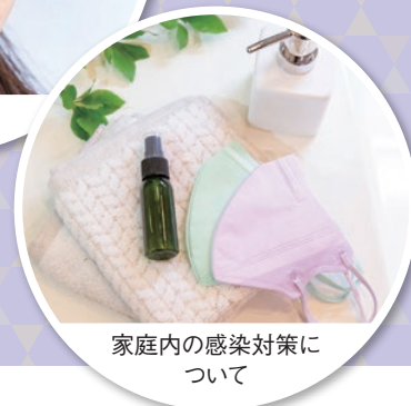
家庭内の感染対策について