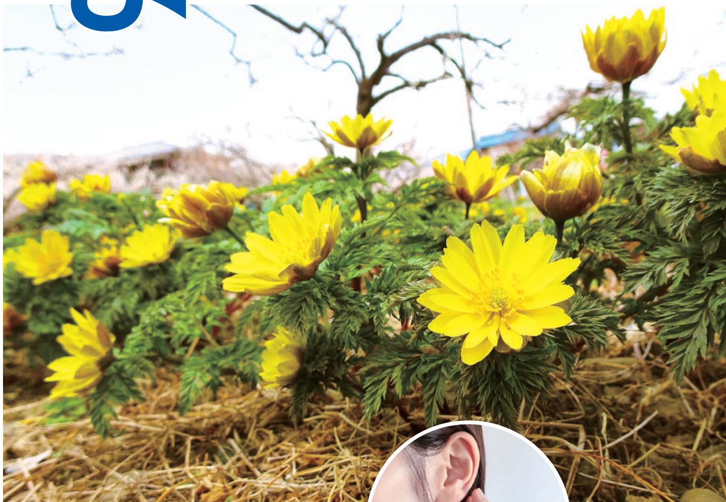
表紙の花「フクジュソウ」