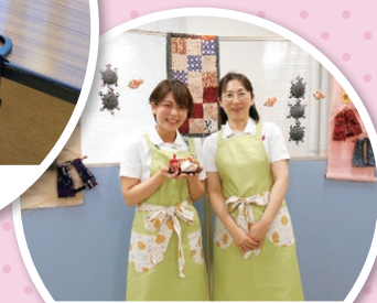
難病サロンを開設します！