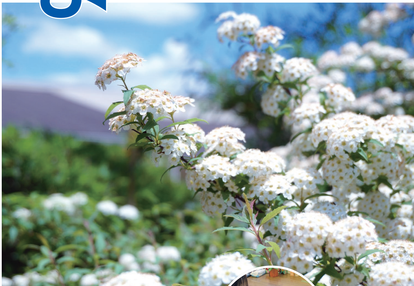
表紙の花「コデマリ」