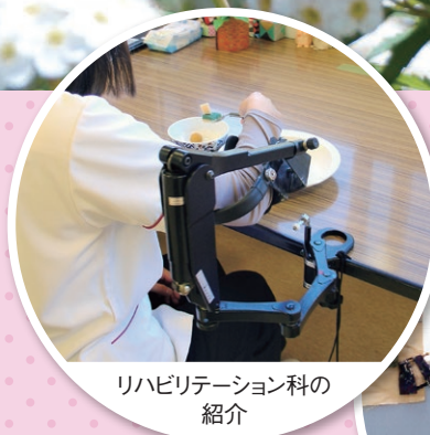
リハビリテーション科の紹介