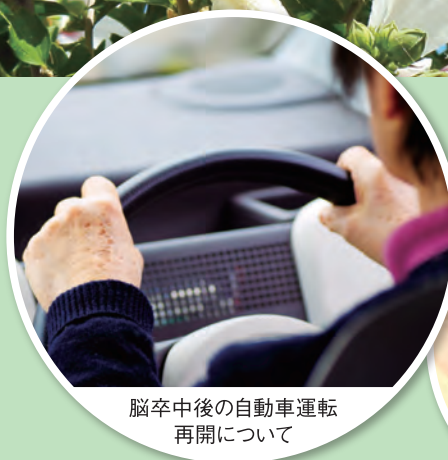
脳卒中後の自動車運転再開について