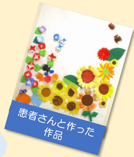
患者さんと作った 作品