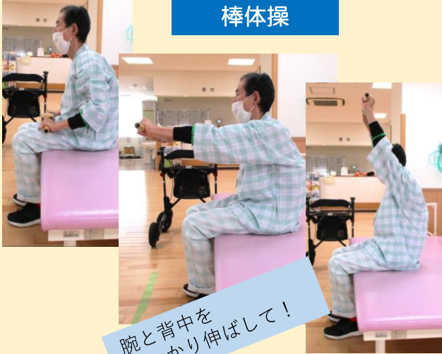
腕と背中を しっかり伸ばして！