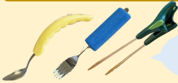
持ちやすい スプーンや お箸