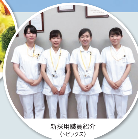
新採用職員紹介 (トピックス)