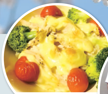
高齢者のための レシピ