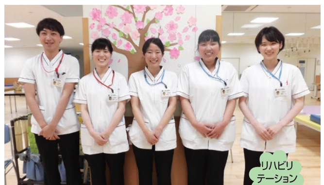
リハビリ テーション 科